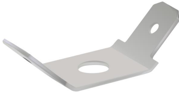
picture shows a tin-plated type