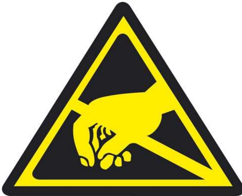
Elektrostatisch gefährdete Bauelemente (Form A)