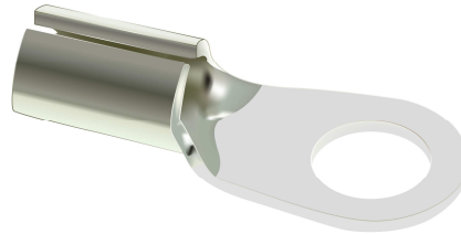
Lötkaabelschuh Ringform 1,5 mm 2 M 4