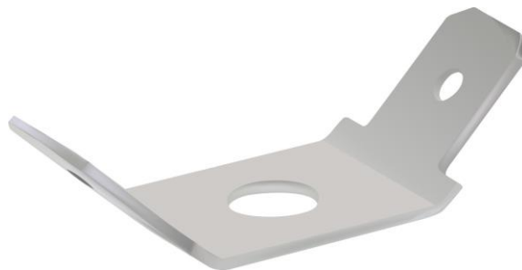
picture shows a tin-plated type