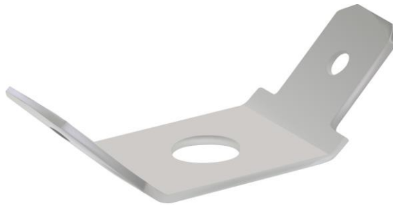
Bild zeigt eine verzinte Ausführung