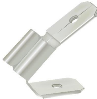
Abbildung zeigt eine verzinkte Ausführung