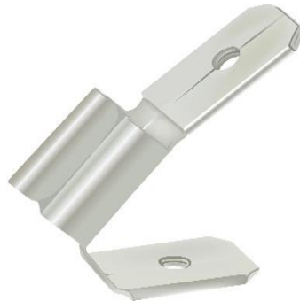
picture shows a tin-plated type