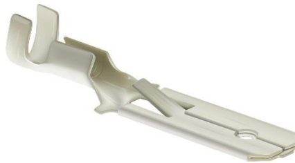
Bild zeigt eine verzinnzte Ausführung