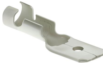
Abbildung zeigt eine verzinkte Ausführung