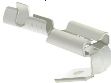
Bild zeigt eine verzinkte Ausführung